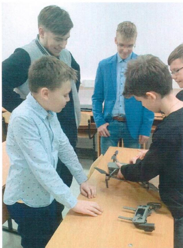
Ученики 6 класса оттачивают мастерство в сборке квадрокоптера